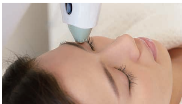
専用チップで、目のキワギリギリまで治療することが可能です。