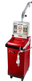
ルートロニック社製 「モザイク」使用