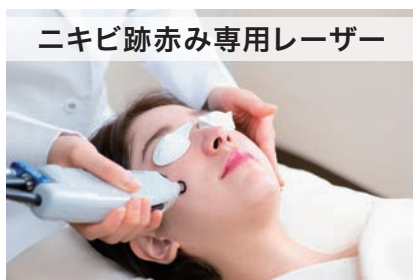
ニキビ跡赤み専用レーザー