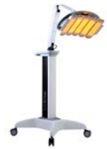
ルートロニック社製

590nmと830nmの2波長を連続照射することで、表皮から筋肉層まで光エネルギーを到達させて、 肌再生に必要な多くの細胞にアプローチすることが可能 となりました。