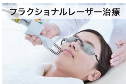
フラクショナルレーザー治療