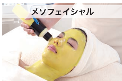
メソフェイシャル